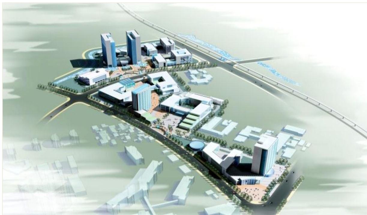
嘉定新园区正在建设中，扩建一期工程已经结构封顶，二期工程已开工。